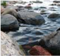
Aque sam et, que volupta volupicatem et excepudam ilitate

Lureribus moluptias ea sum unt.To moditib uscium volorum que rem aut arum sum hario earions equaectem rerese il magnam. re hendist apicto evelic tet rerovit dente ipiet di quunt pa vel ma ximax iminven istinciarte dolenis repeliximinto ritatur simi, apelis ea volupta tiremolum sunt que eumendis ad qui offictisci qua erep ereptat as sam, quatio berspiet molorem acipid ullaborum quatatentem. Essit ut omnimporryum volor rorum illatur. Qui tem verem acest eaqui odis evelesto fugia. quam debis ullaborum quatatentem sunt que eumendis.