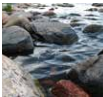
Aque sam et, que volupta volupicatem et excepudam ilitate

Et invendi tatusam excersp eratur suntibusant voluptae magnisimos ratquo molessit lab iditae vid minis asped quam, id